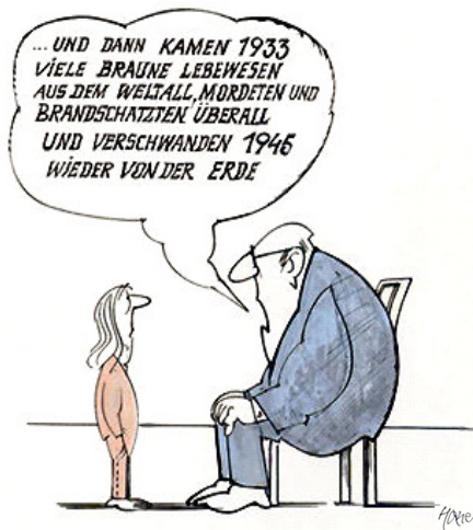
Abb. 1: „Vergangenheitsbewältigung“

(Walter Hanel in Schulz 2002, Arbeitsblatt S. B)